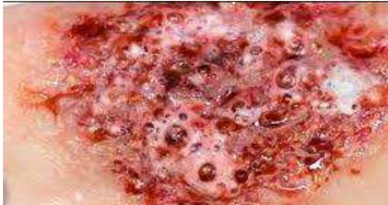
سوختگی ناشی از مواد شیمیایی

این نوع از سوختگی در نتیجه تماس با اسید و باز و ترکیبات شیمیایی ایجاد می گردد. این نوع از سوختگی بیش تر در محیط های صنعتی و تحقیقاتی شایع بوده و می تواند تمام درجات سوختگی را شامل شود.